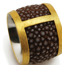
Schmuck Rainer Wiencke - Berlin Bague / Galuchat, or, argent massif 2,5 x 1,9 x 2,5 cm