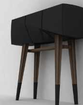
Atelier Huynh - Paris Cabinet « Brut » / Noyer, béton fibré, laiton 120 x 40 x 120 cm

CMA de Paris Béregère Heduit berengere.heduit@cma-paris.fr 01 53 33 53 04