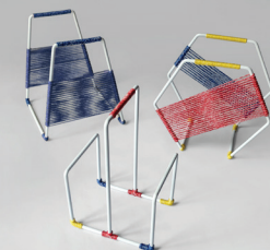
Studio Miriam Josi - Paris Porte-revues RYB / Acier, ficelle recyclée 35 x 35 x 35 cm