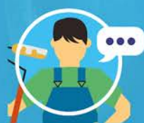
Nicolas DREBON PINCEAUX ET POTS

“ Pour mes chantiers je préfère utiliser les accords et les fournisseurs partenaires HA PLUS PME. Je gagne du temps pour mes commandes et je n’ai plus besoin de négocier ! ”