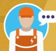
Thierry DARIEUX SARL LAFONTIN

" J'aurais pu acheter mon PC et mon imprimante en grande surface. Avec les accords HA PLUS PME, j'ai pu rénover mon parc informatique avec du matériel de pro et en plus, l'assistance est comprise ! "