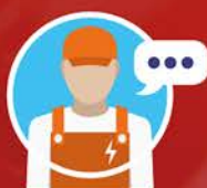
Xavier MORELLE RG ELEC

“ Pour mon activité, les contrôles réglementaires, c'est obligatoire. Avec des tarifs compétitifs déjà négociés, je suis en relation avec des professionnels à l'écoute de mes besoins. Je gagne du temps ! ”